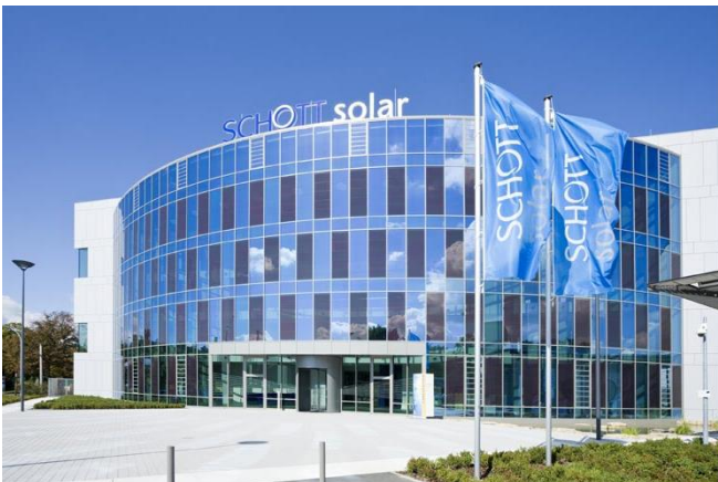
Gebäude DURAN Group GmbH (Marketing/Vertrieb) Hattenbergstraße 6

In das Navigationssystem geben Sie bitte Hattenbergstraße 6 ein.